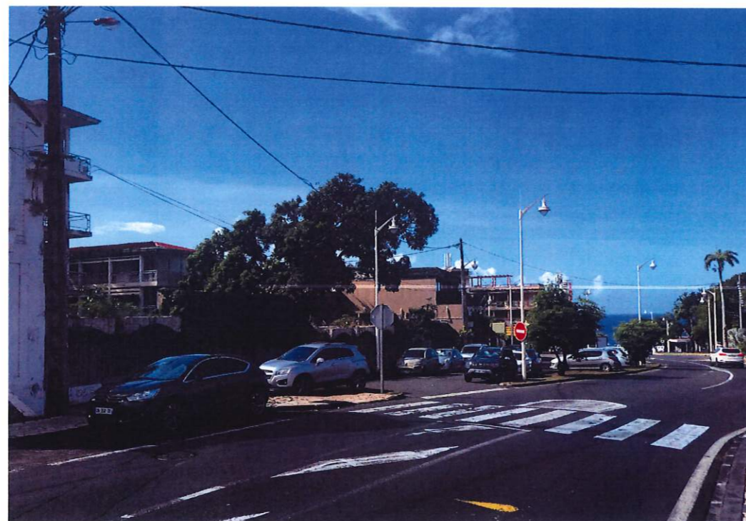
POINT DE VUE 2