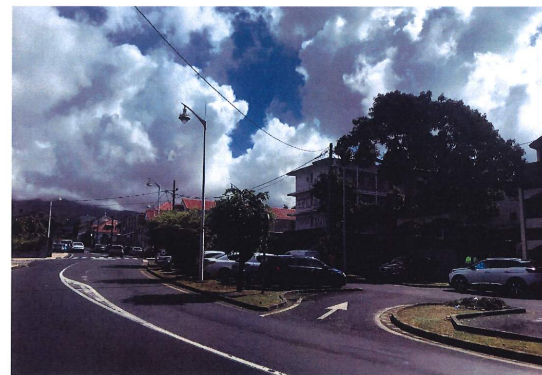
POINT DE VUE 3